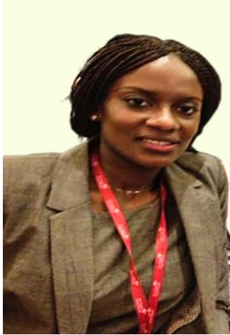
Co-modératrice Jour 2