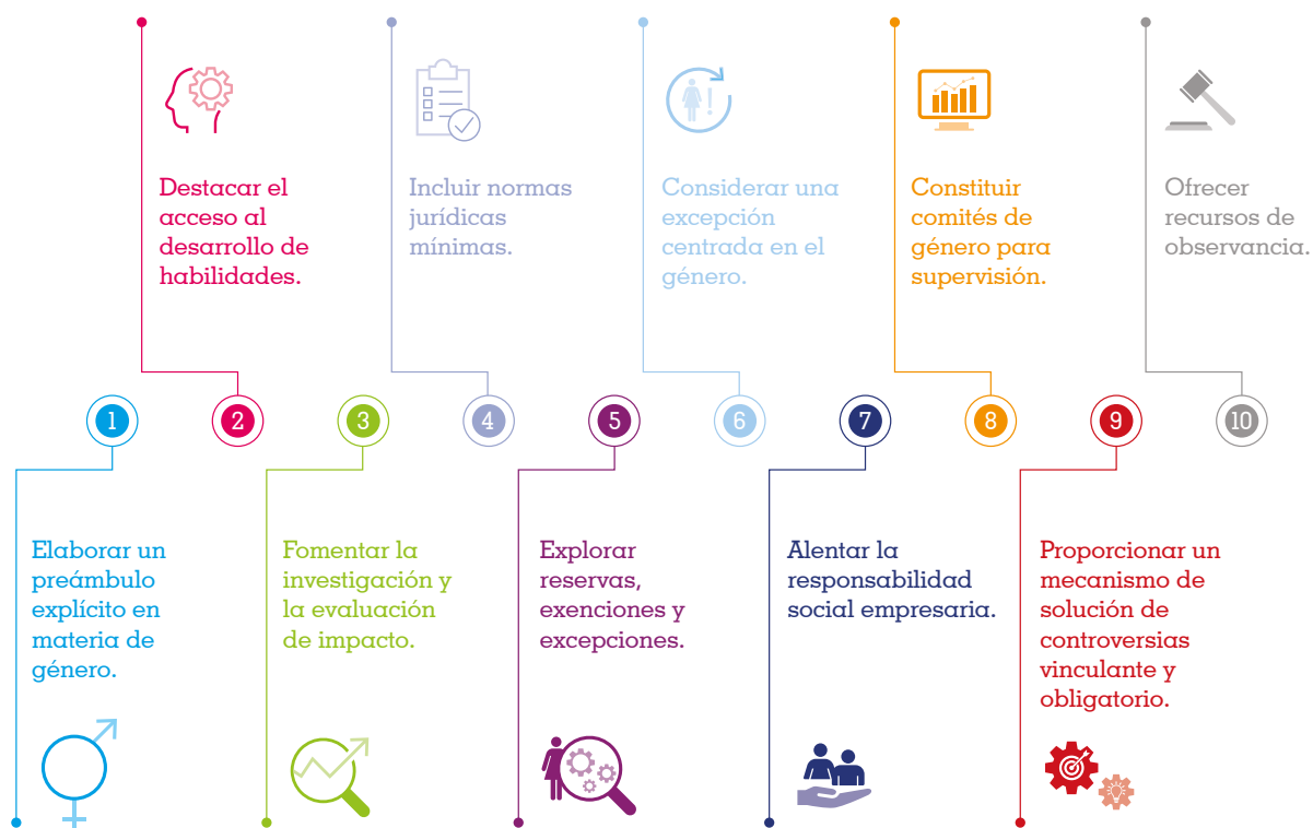
Figura 3 Diez recomendaciones: El género en los tratados de libre comercio

Algunas cláusulas modelo implican obligaciones jurídicas. Otras son disposiciones de intención, por lo que su aplicación depende de la voluntad y los recursos de las partes. Los países pueden ajustar el lenguaje de estas disposiciones para hacerlas más flexibles o más estrictas, dependiendo de la propia voluntad política, las necesidades socioeconómicas, las leyes nacionales vigentes y los recursos disponibles.