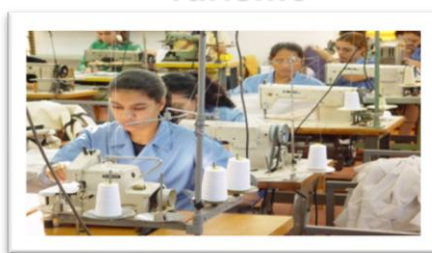
Textil - Confecciones