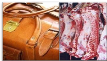
Carne y Cuero