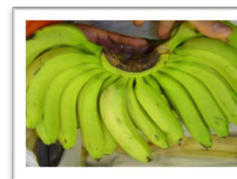
Frutas y Hortalizas